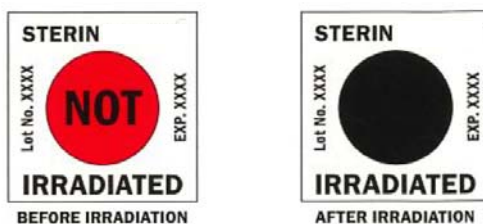
Exemplos do Sterin™ antes e depois da irradiação

Resumo do desempenho: STERIN™ permite a verificação visual permanente da irradiação na dose mínima indicada ou acima dela.