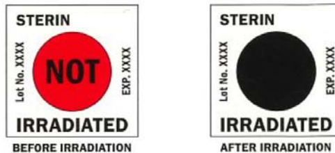
Exemples d'indicateurs Sterin™ avant ou après irradiation

Résumé des performances : STERIN™ fournit une vérification visuelle permanente du respect du niveau d'irradiation en fonction de la dose minimale indiquée imprimée.